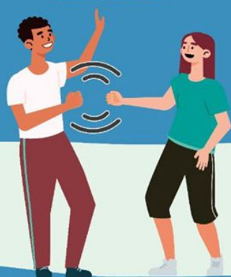
CON EL PUÑO DE LEJOS