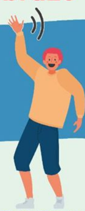
AGITANDO LAS MANOS