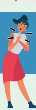
JUNTANDO LAS MANOS