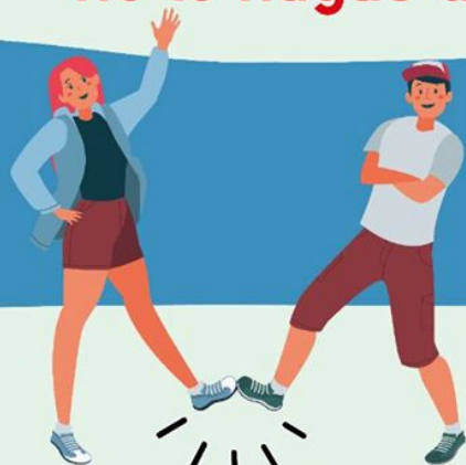
CON EL PIE